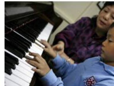
Muziekles goed voor het brein

Al ben je gespeend van enig muzikaal talent, het leren bespelen van een instrument kan helpen allerlei vaardigheden te verbeteren, menen de onderzoekers. 'Het verscherpt je gehoor, niet alleen voor muziek maar ook voor spraak, omdat het de hersenen traint in het geven van betekenis aan wat je hoort,' aldus wetenschapper Nina Kraus in de Chicago Tribune.